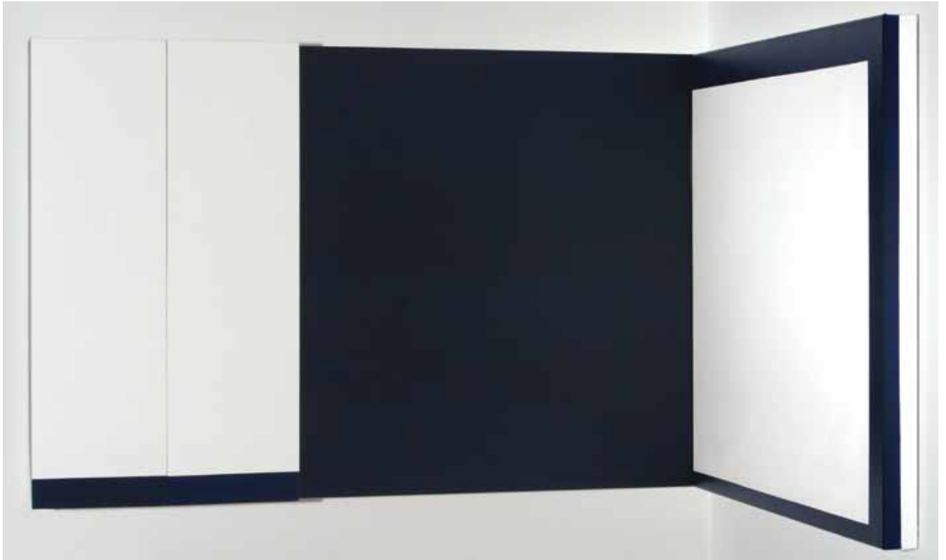
Elizabeth Jobim Sem título, 2010 Óleo sobre linho 70 x 160 x 10 cm