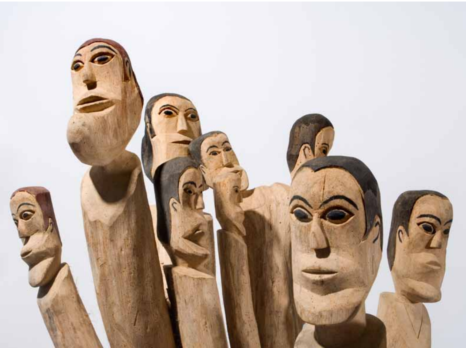
Aberaldo Santos Sem título, 2008 Madeira, detalhe 135 x 83 x 123 cm