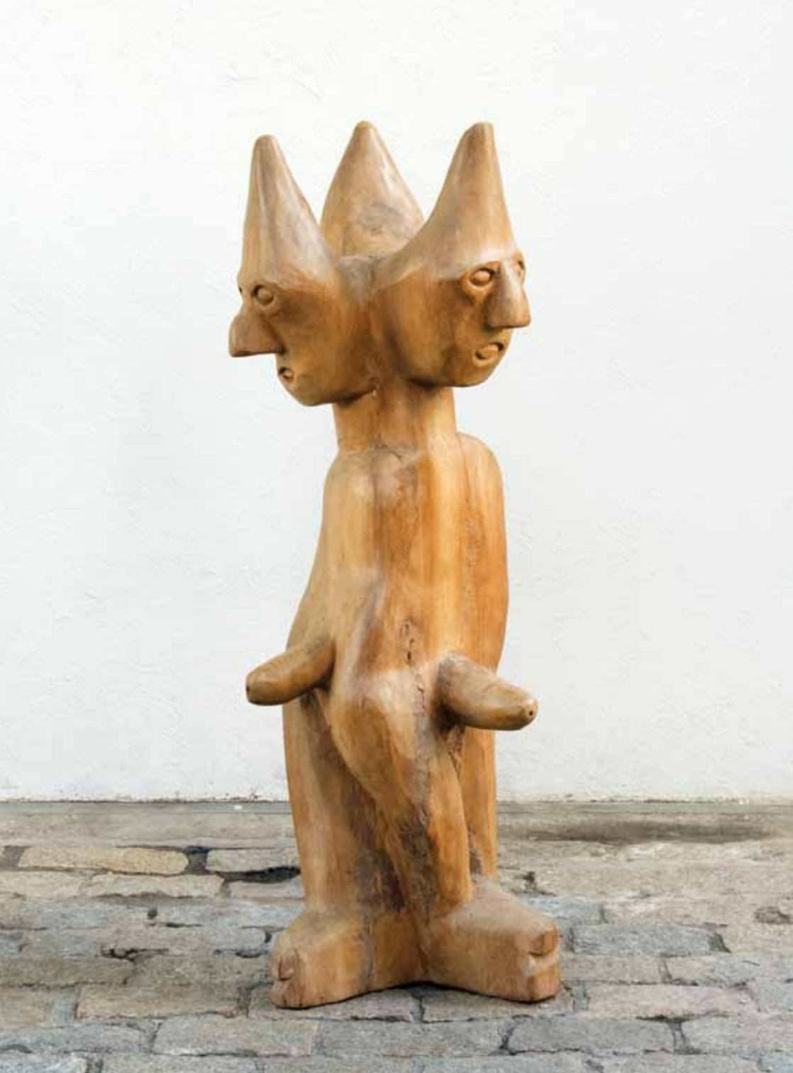
Sem título, 2008 Escultura em madeira 128 x 48 x 52 cm