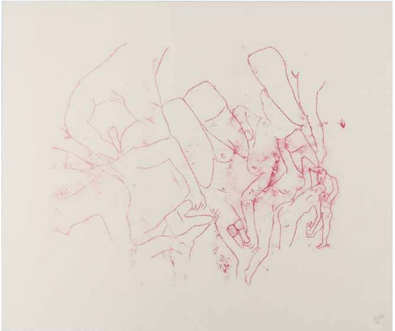
Sem título, 2005 Litografia 4/10 60 x 70 cm